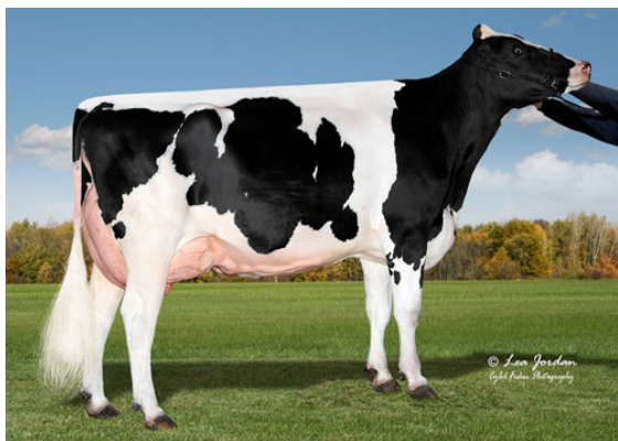
COOKIECUTTER HOPELYNN GRANDDAM